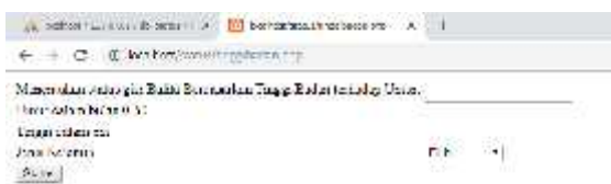
Gambar 7. Proses Menginputkan Data Tinggi

Aplikasi ini sudah dibuat dalam bentuk apk dan sudah dipublikasikan di playstore dengan nama Gizi Balita. Dengan tampilan seperti Gambar 8.