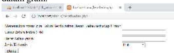
Gambar 6. Proses Menginputkan Data Berat

Di mana inputan dari masing-masing zscore untuk status berat badan, seperti Gambar 6, dan untuk status tinggi badan berdasarkan usia dalam Gambar 7. Inputannya, yaitu: Jenis_Kelamin, Usia dalam Bulan, Tinggi Badan dalam cm, dan Berat badan dalam gram.