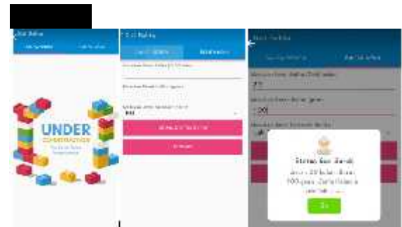
Gambar 8. Hasil Tampilan Aplikasi APK

Aplikasi ini sudah dibuat dalam bentuk apk dan sudah dipublikasikan di playstore dengan nama Gizi Balita. Dengan tampilan seperti Gambar 8.